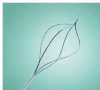
Helicoidal con punta