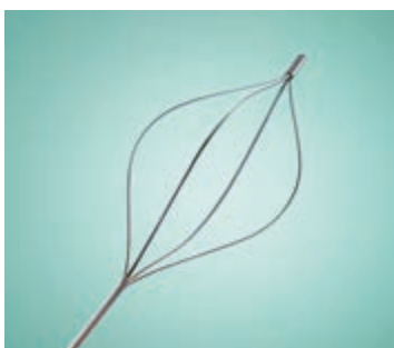
Gerade mit Spitze