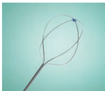
Gerade ohne Spitze