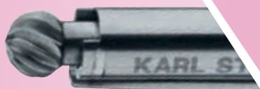
Broca redonda 4 mm Ø, 15°