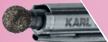
Broca diamantada 3,6 mm Ø, 70°