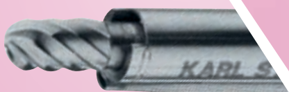
Broca cilíndrica 3 mm Ø, 40°