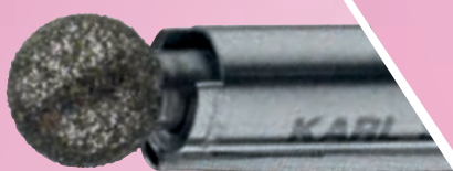
Broca diamantada 5 mm Ø, 40°