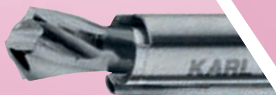
Broca en forma de diamante 4 mm Ø, 40°