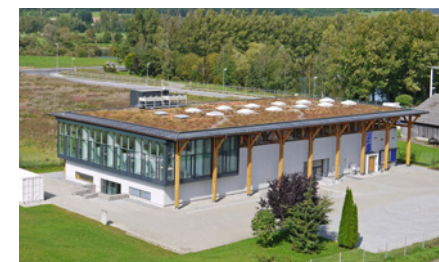
Центр обслуживания клиентов KARL STORZ