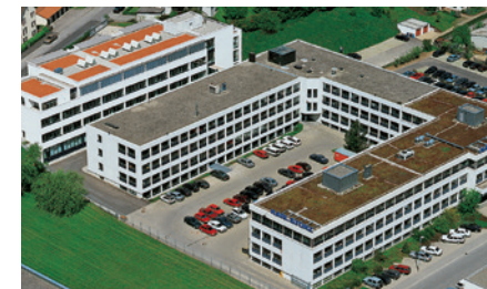
Производство / Исследования и разработки KARL STORZ