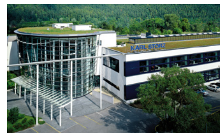
カールストルツ社本社/訓練センター