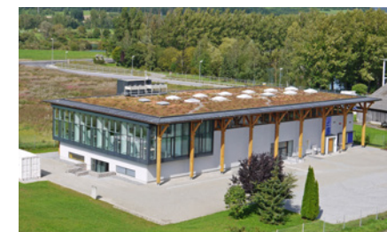
カールストルツ社デジタルセンター