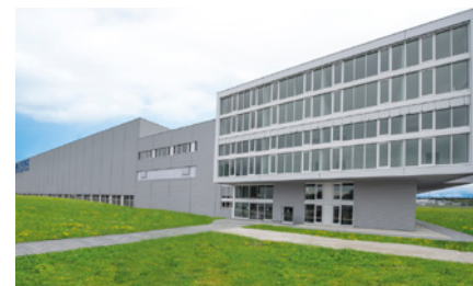
KARL STORZ Logistikzentrum