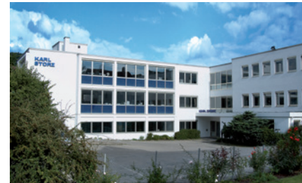
KARL STORZ Administration / Museum