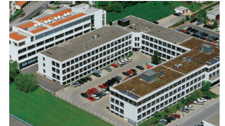
KARL STORZ Produktion / Forschung- und Entwicklung