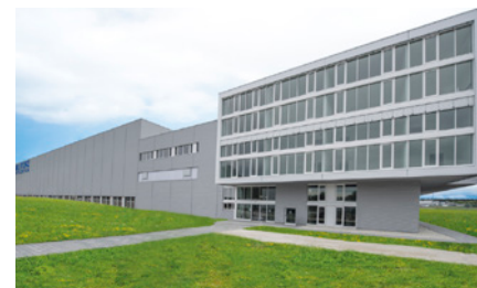
Centro de logística KARL STORZ