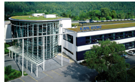
Central/centro de treinamento KARL STORZ