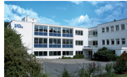
Administração/ museu KARL STORZ