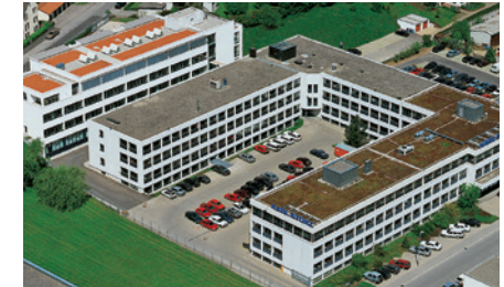
Produção/pesquisa e desenvolvi- mento da KARL STORZ