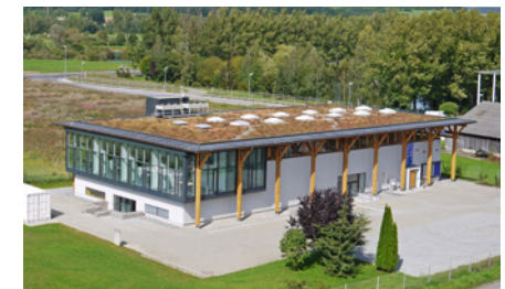
Centro de visitantes KARL STORZ