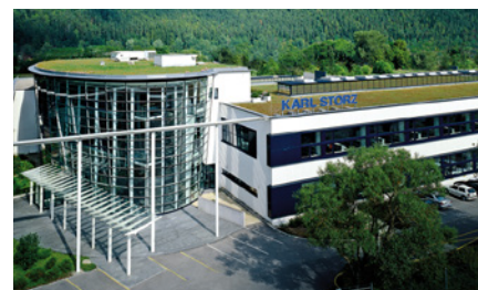
Sede centrale / centro di formazione KARL STORZ