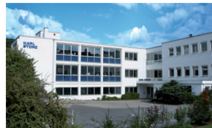
Amministrazione / museo KARL STORZ

Se si arriva in treno è consigliabile prendere un taxi a Tuttlingen. I taxi si trovano direttamente davanti alla stazione. La corsa dalla stazione di Tuttlingen fino alla KARL STORZ dura circa 10 minuti.