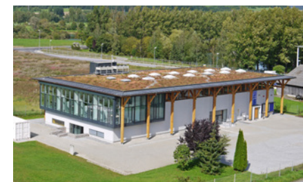
Centro visitatori KARL STORZ