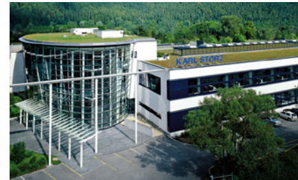
KARL STORZ - Central / Centro de formación